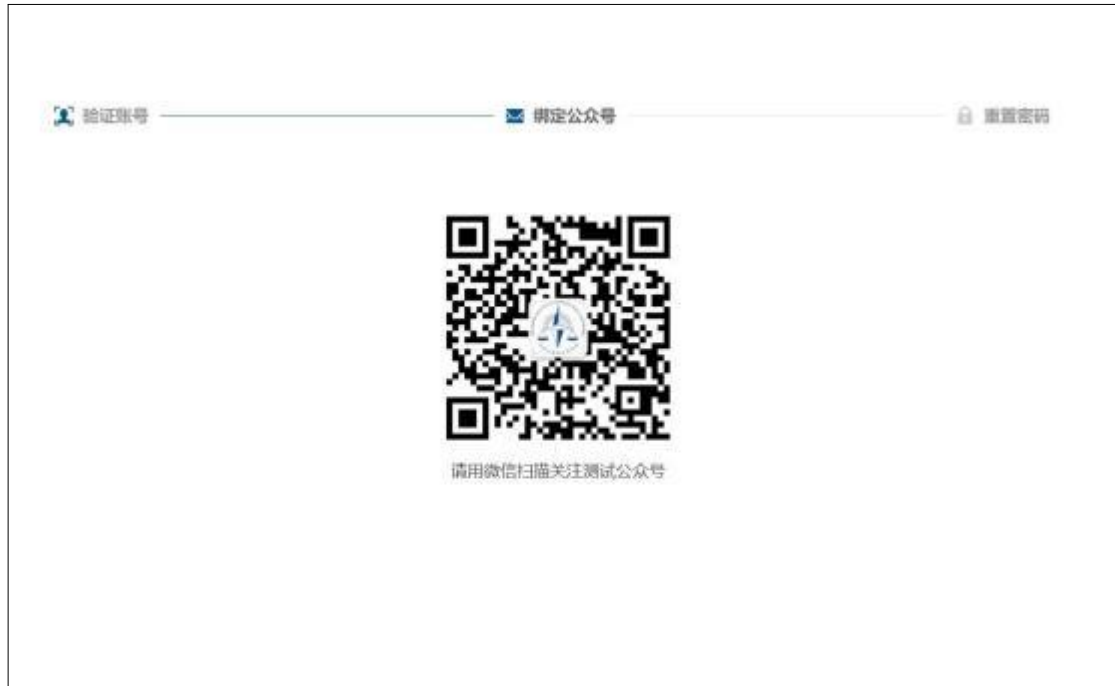
2-6 中国注册会计师协会行业管理信息系统公众号二维码界面

4、注册会计师已绑定公众号时会展示验证码接收界面。点击发送验证码可将修改密码验证信息发送到公众号上。注册会计师可通过公众号查看验证码，输入验证码后点击【下一步】跳转至新密码设置界面。