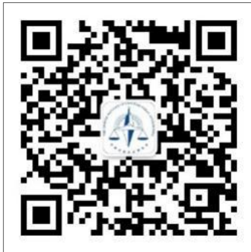
1-1 中国注册会计师协会行业管理信息系统公众号二维码

1、注册会计师（非执业会员）可通过微信扫描“中国注册会计师协会行业管理信息系统”二维码关注公众号通过微信公众号找回。注册会计师点击“我的”-“找回密码”跳转到密码找回界面。