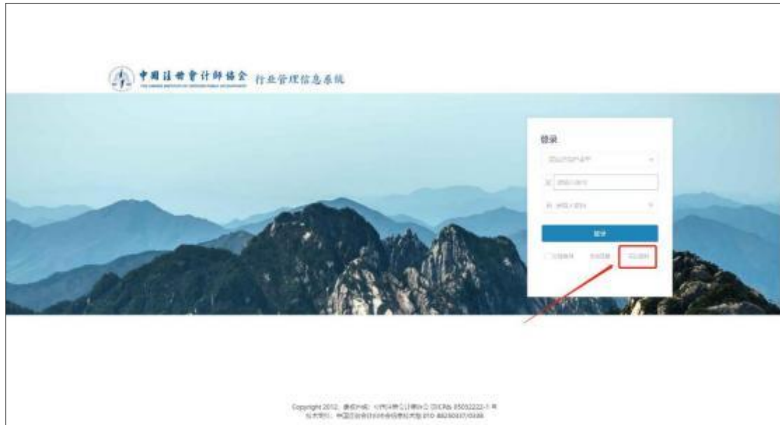
2-4 年检系统登陆界面

2、注册会计师在密码重置界面用户类型选择注册会计师，找回的账号为登录系统的用户名即注册会计师证书编号。用户类型和找回账号填写完成后点击【下一步】跳转到验证码接收界面。