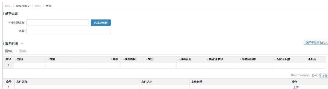
图 2 报名信息录入界面